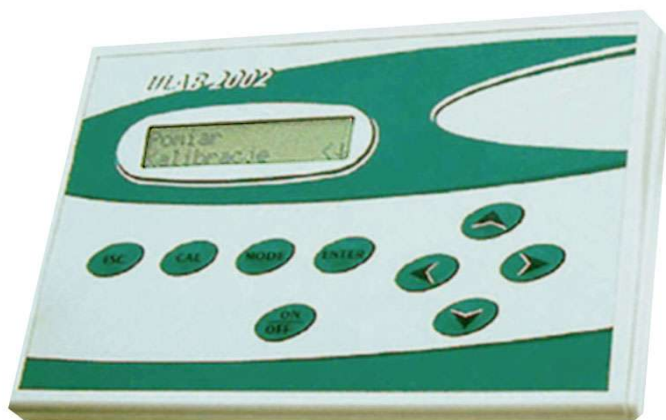
Rys. 1 Wygląd zewnętrzny

Pehametr ULAB 2002 stosuje się w warunkach laboratoryjnych do pomiaru stężeń jonów wodorowych (pH) oraz potencjału redoks (ORP) w wodzie i roztworach wodnych. Zastosowanie w pehametrze układu mikroprocesorowego zapewnia uzyskanie dobrych parametrów metrologicznych i zwiększa jego niezawodność. Z powodzeniem może służyć w laboratoriach związanych z przemysłem chemicznym, spożywczym, farmaceutycznym, energetycznym, ochroną środowiska, w szkolnych pracowniach chemicznych, laboratoriach naukowych itp..